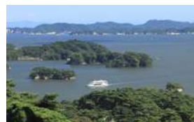
ประมาณ 30 นาทีจากมัดสึชิมะ