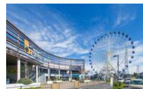
从三井奥特莱斯仙台港 出发步行约10分钟