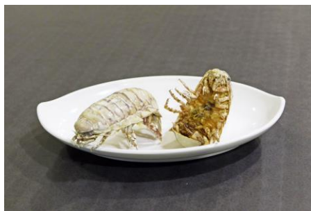
【オオグソクムシ 姿揚げ】