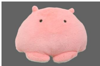
【もちだっこクッション メンダコ】

島内のショップでは、深海生物をモチーフにした可愛いぬいぐるみや、ちょっと変わったお菓子などインパクトのあるグッズを多数販売しております。