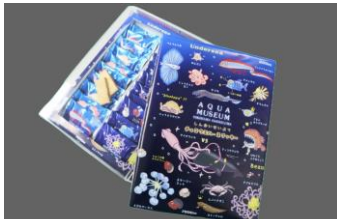
【深海生物お菓子箱】