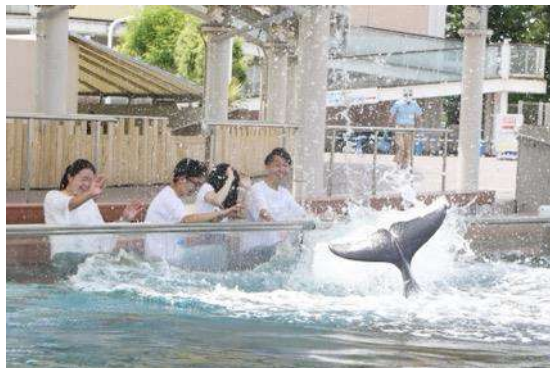
バンドウイルカのスプラッシュタイム

暑い夏は開放的な空間で、イルカたちによる涼しい“ずぶ濡れの夏”をお楽しみください。